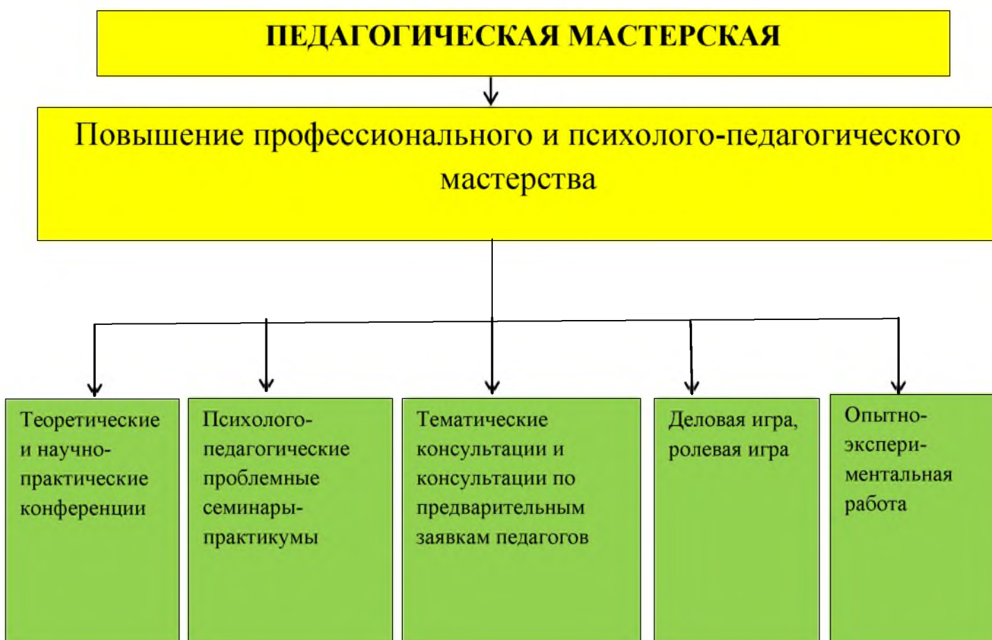
Схема № 2.

В работе «Педагогической мастерской» используются как традиционные, так и инновационные формы организации обучения (см. схему №2).